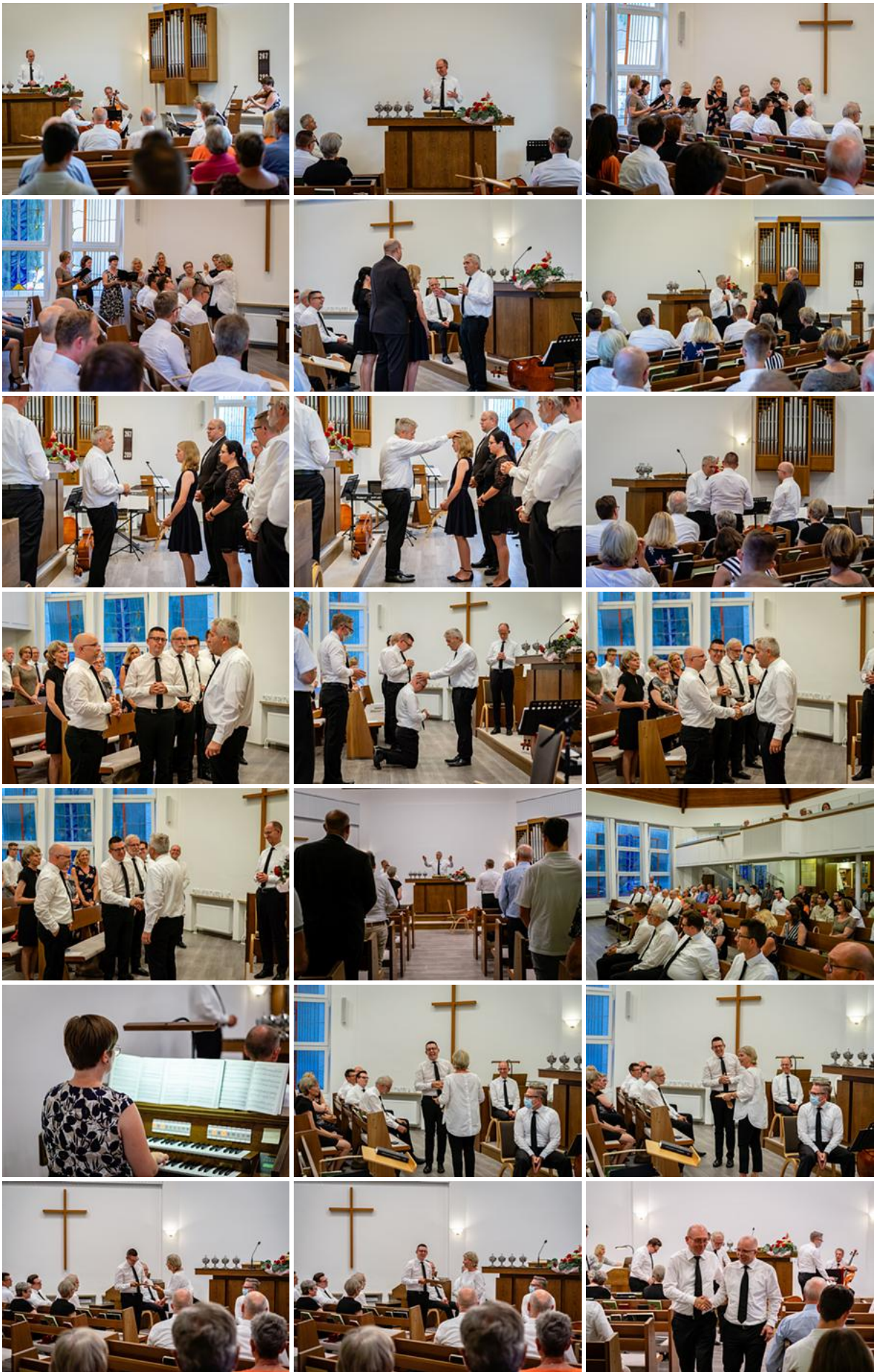
Neuer Vorsteher für die Gemeinde Benrath