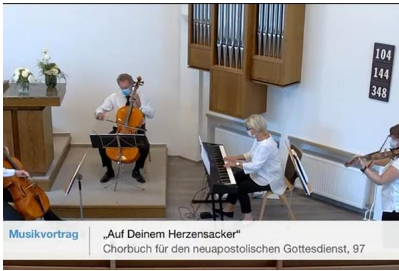
Musikvortrag „Auf Deinem Herzensacker“ Chorbuch für den neapostolischen Gottesdienst, 97